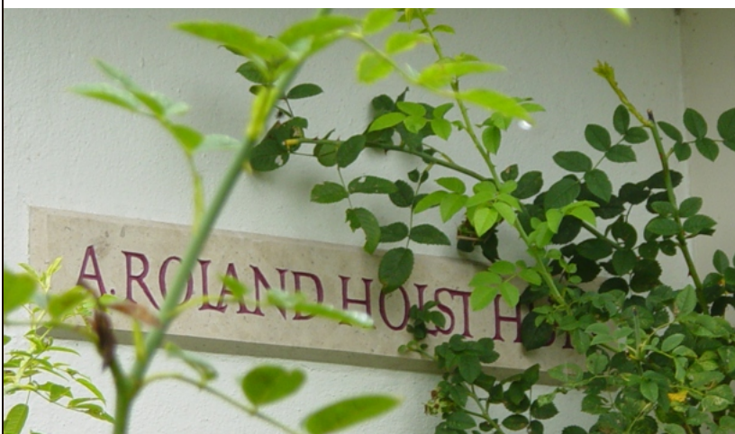
Het huis van dichter A. Roland Holst in Bergen aan de Noordzee: het Sint-Martens-Latem van Noord-Holland.