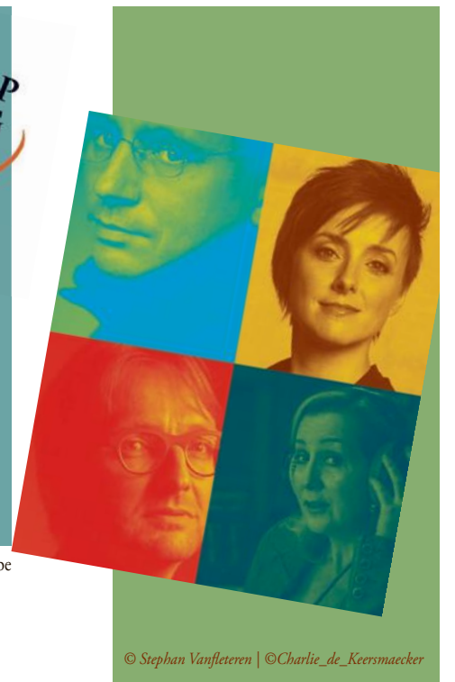
© Stephan Vanfleteren | © Charlie_de_Keersmaecker